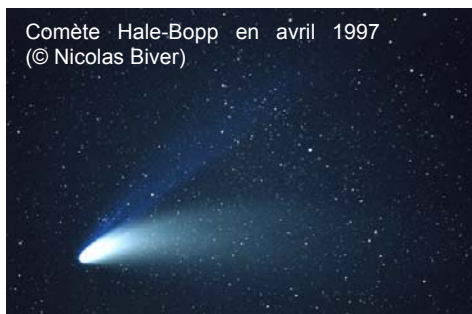
Comète Hale-Bopp en avril 1997

Les comètes comptent parmi les corps les plus mystérieux du Système Solaire. Elles se sont formées à partir du matériau contenu dans un nuage moléculaire qui s'est effondré sur lui-même pour donner naissance à notre Soleil et à son cortège de planètes.